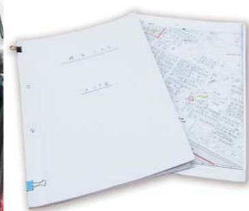
▲家づくりはゴールで□は なくこれから毎日□日生活 していくため□のスタート。 住宅設□備もイテ45w