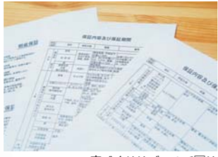
▲家づくりはゴールで□は なくこれから毎日□日生活 していくため□のスタート。 住宅設□備もイテ45w